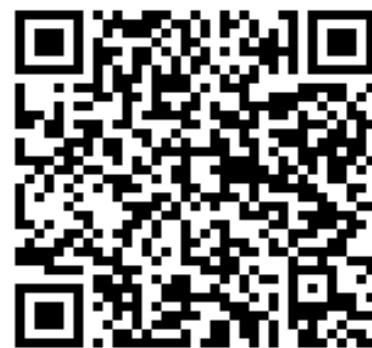
Сборник «Педагоги дополнительного образования Мостовщины»